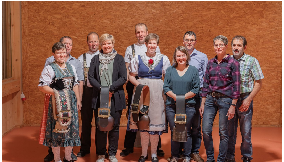
Die Geehrten aus dem Kanton Appenzell Innerrhoden und Ausserrhoden.