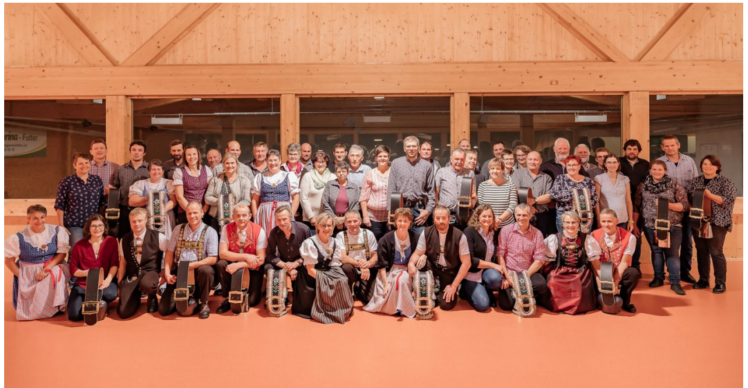
Die Geehrten aus dem Kanton St. Gallen.