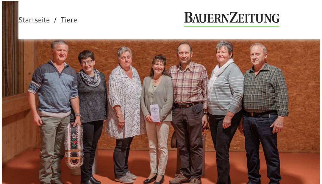
Die Geehrten aus dem Kanton Schwyz