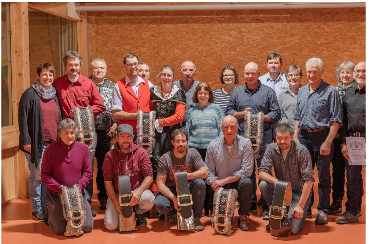
Die Geehrten aus dem Kanton Graubünden