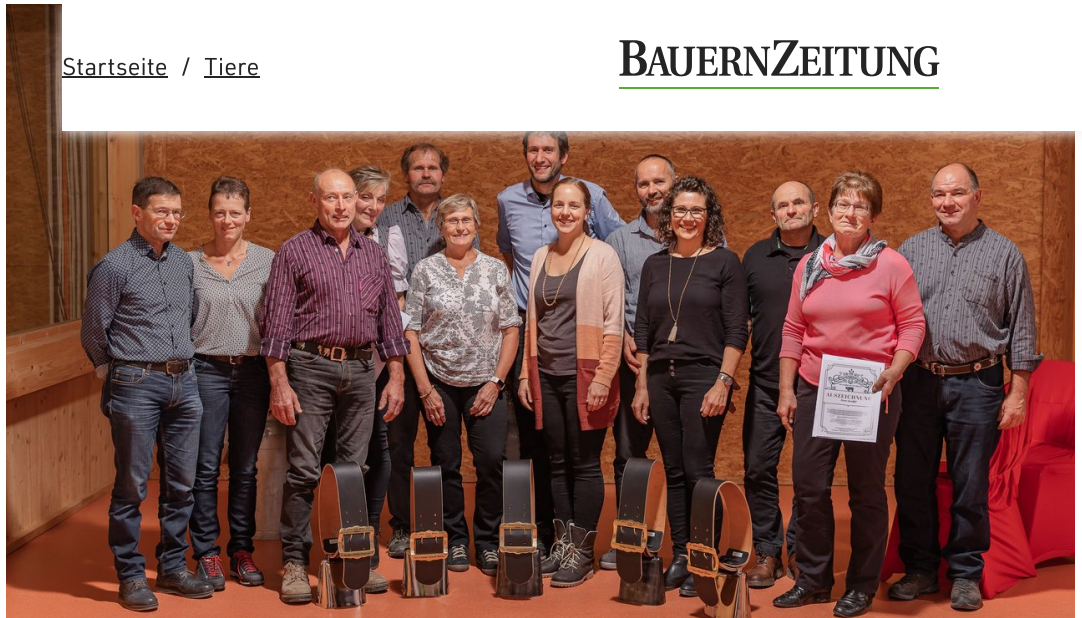
Die Geehrten aus dem Kanton Glarus